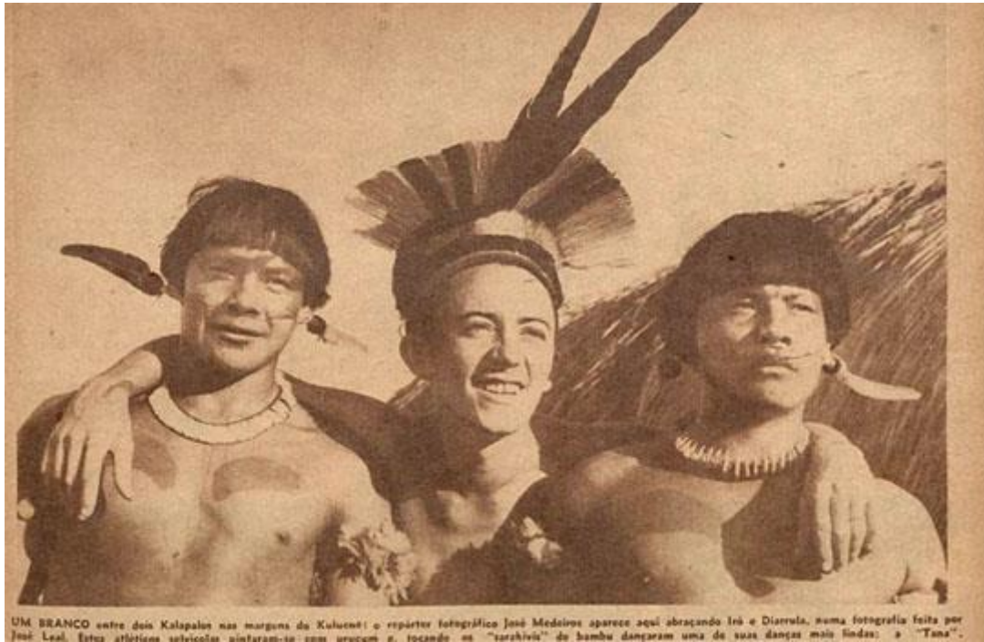
O Cruzeiro, 4 de junho de 1949

Sob a bandeira da FAB - II - Eis os xavantes, a tribo inquieta - Texto de Jorge Leal e fotos de José Medeiros ( O Cruzeiro, 4 de junho de 1949 ). Segunda matéria de uma série de reportagens sobre os índios do Xingu durante a primeira Expedição da Aeronáutica comandada pelo brigadeiro Raimundo Vasconcelos Aboim (1898 - 1990), responsável pela Diretoria de Materiais da Aeronáutica. Fotos de índios com o brigadeiro Aboim, com o cozinheiro da expedição, índios em canoa, de índios nus se preparando para dançar para o brigadeiro, do sertanista Orlando Villas-Boas (1914 - 2002) com índio, do sertanista Francisco Meirelles (1908 - 1973), do Serviço de Proteção ao Índio, índios com caldeirões e panelas nas mãos, do coronel Seroa da Mota, do capitão da Fab, Ubiratan Favila; várias dos índios xavantes, do local onde estão enterrados os integrantes da expedição de Pimentel Barbosa, do coronel Montenegro.