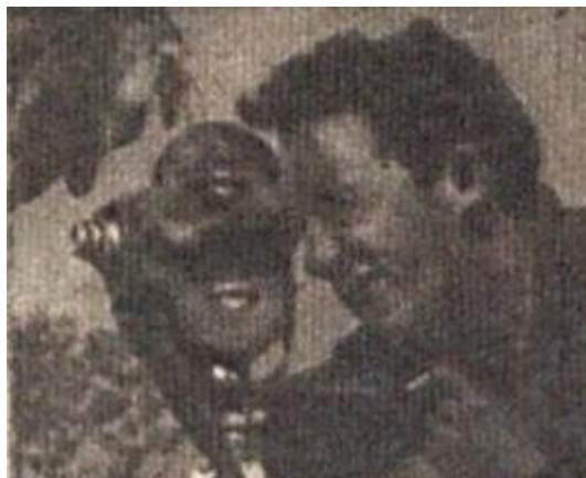
O Cruzeiro Internacional, 1º de abril de 1958