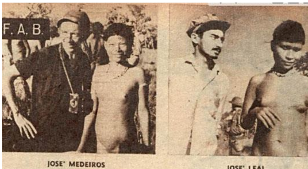
O Cruzeiro, 22 de julho de 1950