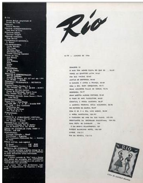
Revista Rio, janeiro de 1946