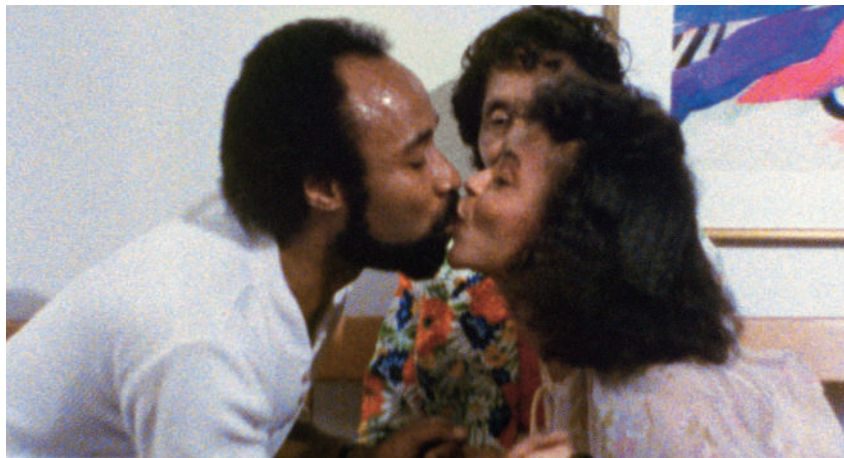
Mulheres mais velhas e o amor ( Older Women and Love ), de Camille Billops e James Hatch (EUA | 1987, 27', DCP)

Suzanne, Suzanne, de Camille Billops e James Hatch (EUA | 1982, 26', DCP)