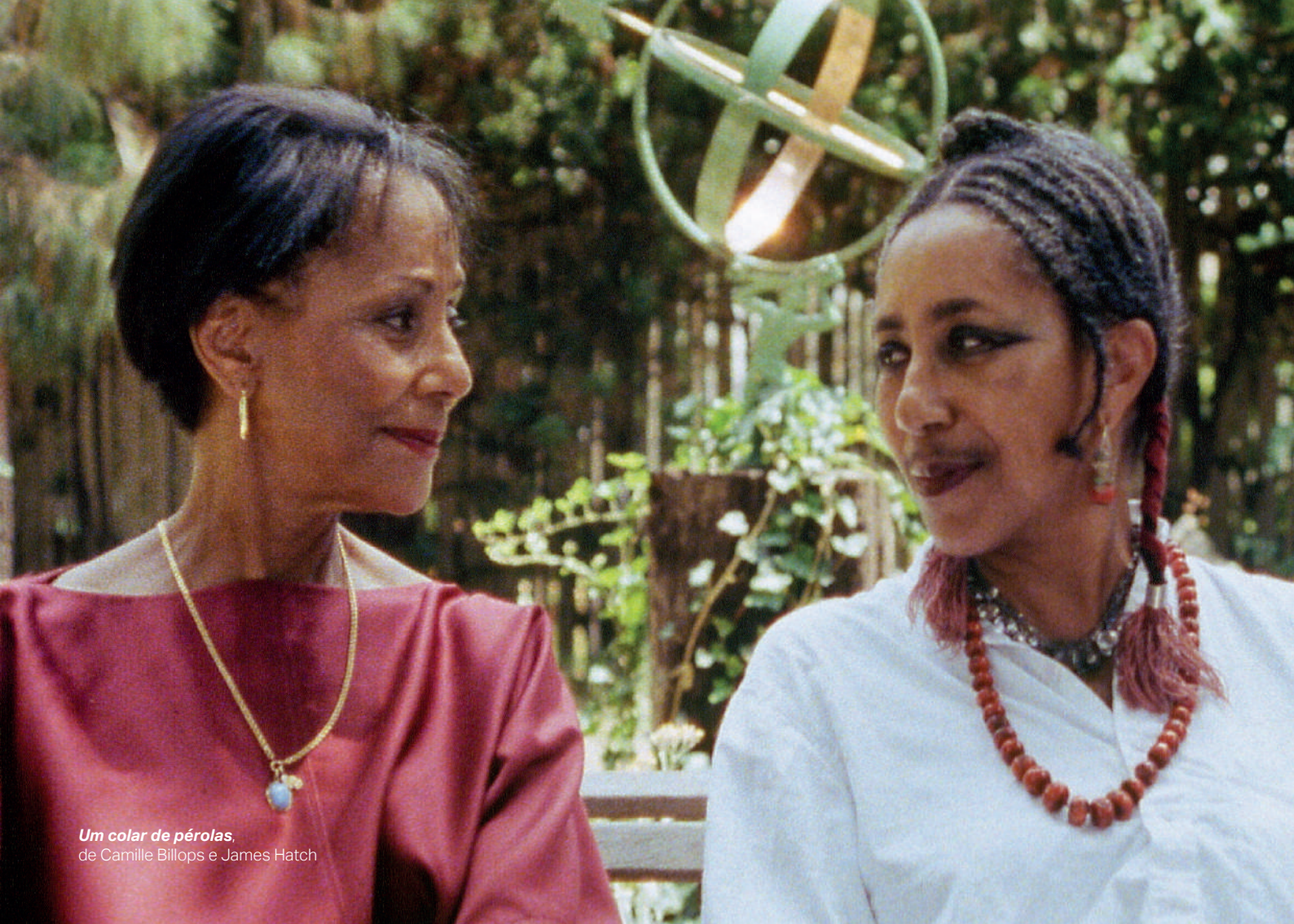
Um colar de pérolas, de Camille Billops e James Hatch