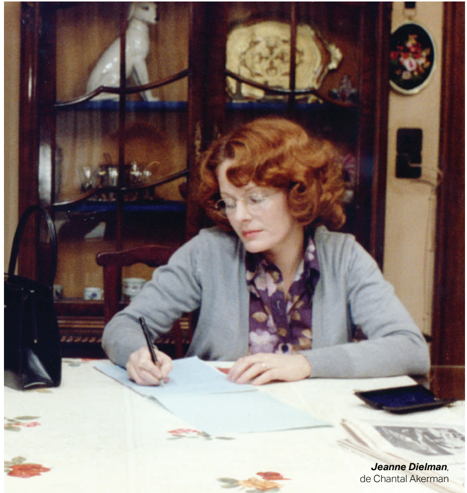
Jeanne Dielman, de Chantal Akerman

Jeanne Dielman ( Jeanne Dielman, 23, quai du Commerce, 1080 Bruxelles ) Chantal Akerman | DCP