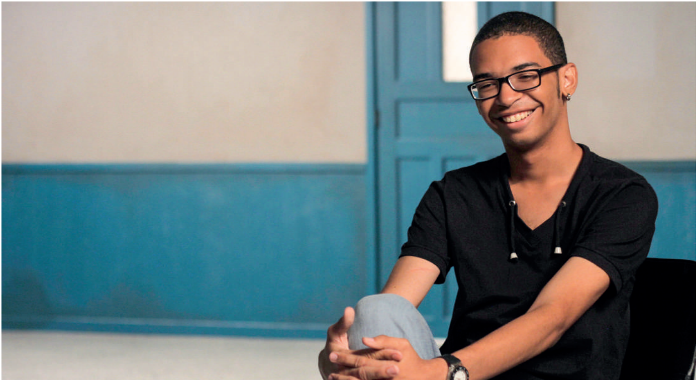
Últimas conversas , dirigido por Eduardo Coutinho, montado por Jordana Berg e terminado por João Moreira Salles

existiam outras também. Um dos filmes que poderia ter se seguido a As canções e que acabou não sendo feito foi o Reencontros , que seria a volta de Coutinho