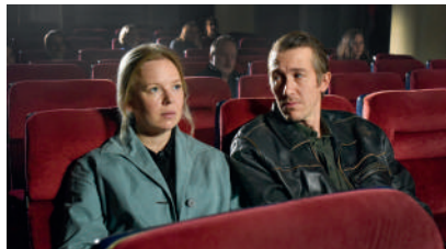
Folhas de outono ( Kuolleet lehdet ), de Aki Kaurismäki (Finlândia, Alemanha | 2023, 81', DCP)