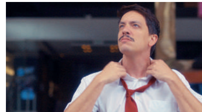
Psico S/A, de Alessandro Guimarães (Brasil | 2023, 17', arquivo digital)