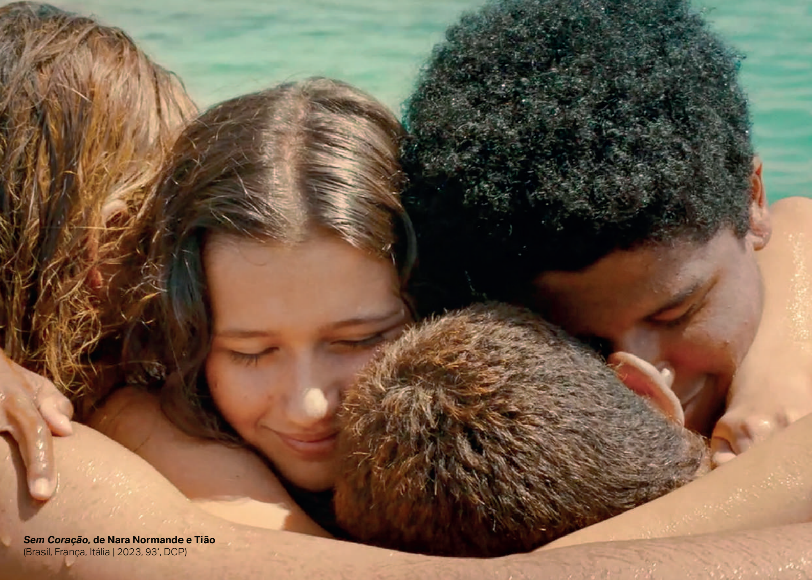
Sem Coração , de Nara Normande e Tião (Brasil, França, Itália | 2023, 93', DCP)