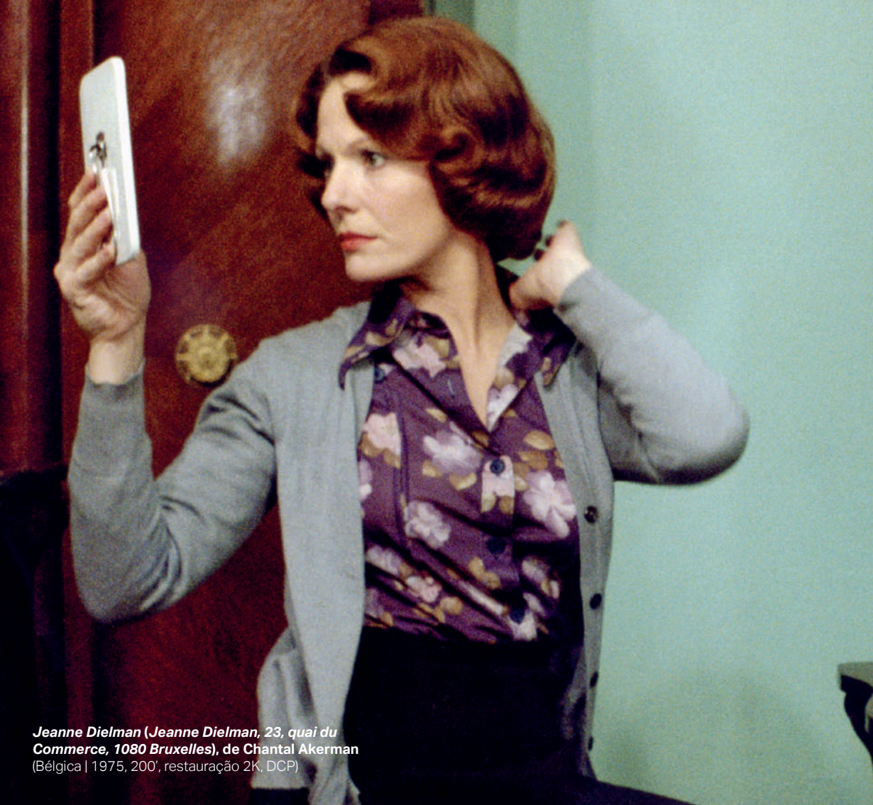
Jeanne Dielman (Jeanne Dielman, 23, quai du Commerce, 1080 Bruxelles), de Chantal Akerman (Bélgica | 1975, 200', restauração 2K, DCP)

Visitação: terça a sexta, das 13h às 19h. Sábados e domingos, das 9h às 19h. Entrada gratuita.